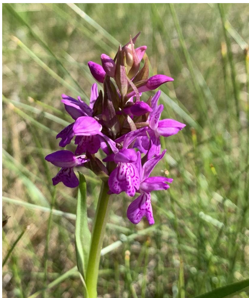
Smalmarihand, Dactylorhiza majalis ssp. sphagnicola Fra Høymyr i Siljan 25-06-23